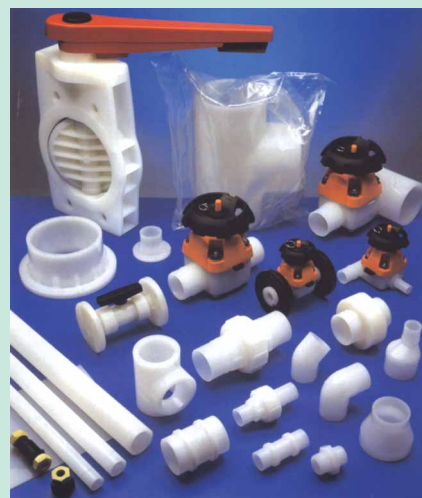
Рис. 1-3 – ПВДФ был выбран для системы трубопроводов воды очищенной в фармацевтическом производстве, поскольку в его состав не входят наполнители, пигменты и стабилизаторы. На внутренней поверхности труб из ПВДФ не происходит осаждение и рост микроорганизмов.